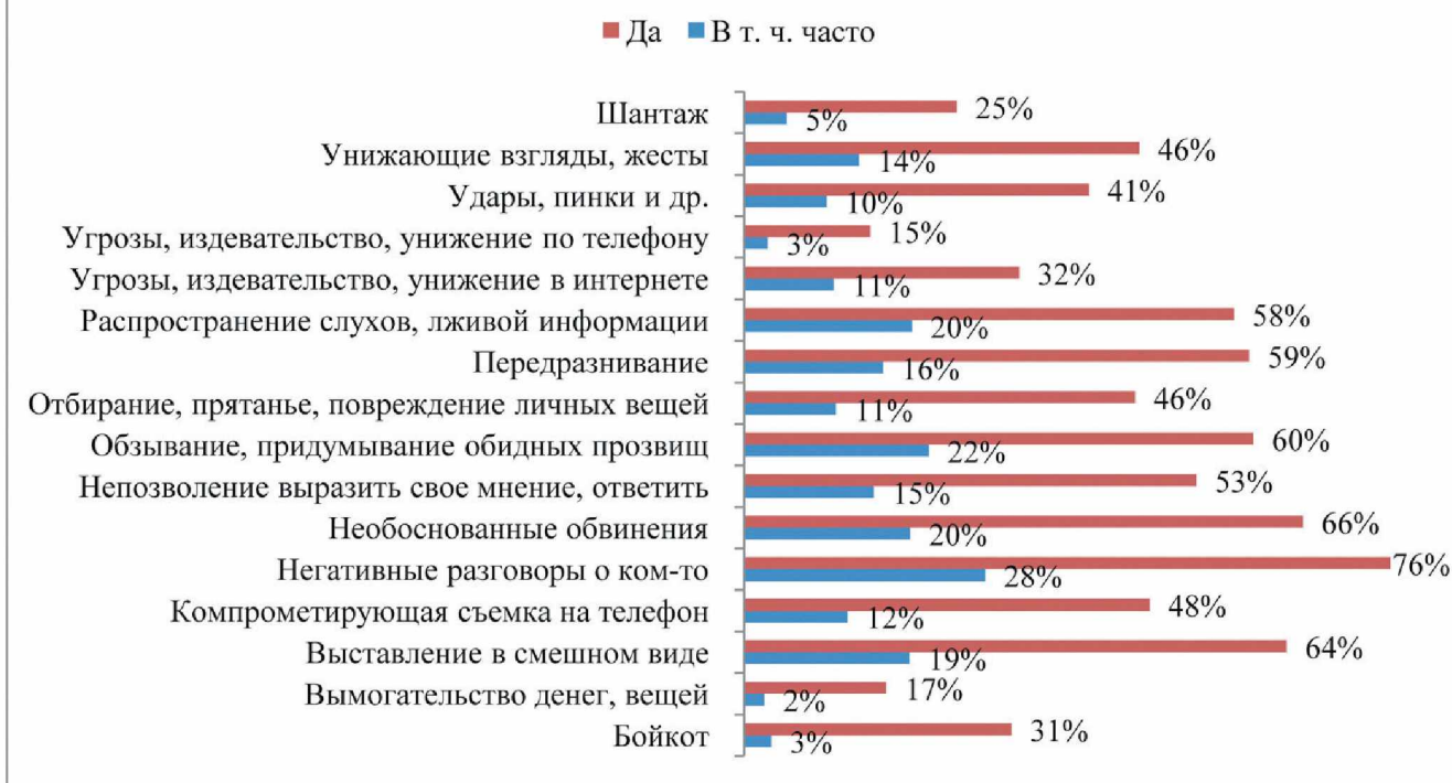
Диаграмма 1. "Сталкивались ли вы с ситуациями, когда кого-то из сверстников донимал вас с особой настойчивостью?"

– меньший, по сравнению со школой, контроль со стороны педагогов.