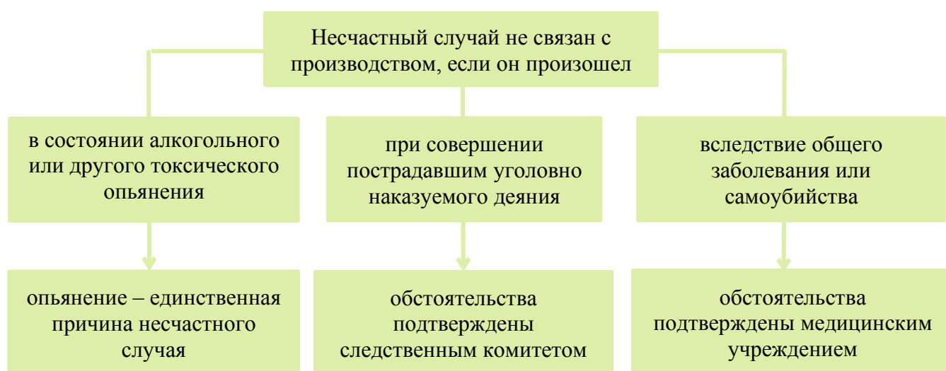
Рис.1. Квалификация несчастного случая как несчастного случая, не связанного с производством

Документы (материалы), оформленные по результатам расследования несчастного случая (приложение №2):